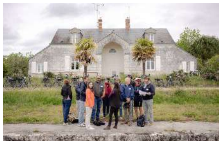
© Yoan Jäger-Sthul – Maison éclésièrre