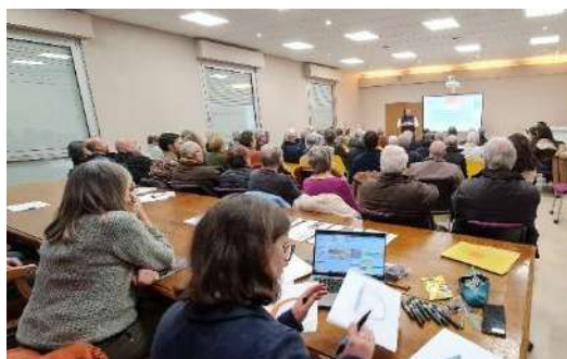
© NEC – Réunion publique Etude Affluents