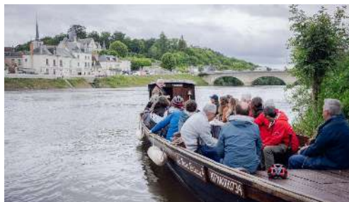
© Yoan Jäger-Sthul – Véretz – Mariniers Jean Bricau

Le programme ambitieux de restauration des milieux aquatiques démarré en 2020 avance bien, tant sur le Cher, que sur ses affluents et à l'échelle du bassin versant.