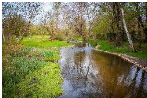
Le Petit Cher restauré

Partenaires du Contrat territorial « Cher canalisé et affluents » : l'Agence de l'eau Loire-Bretagne, la Région Centre-Val de Loire, les deux départements 37 et 41, les acteurs économiques, associations locales ainsi que les habitants du territoire