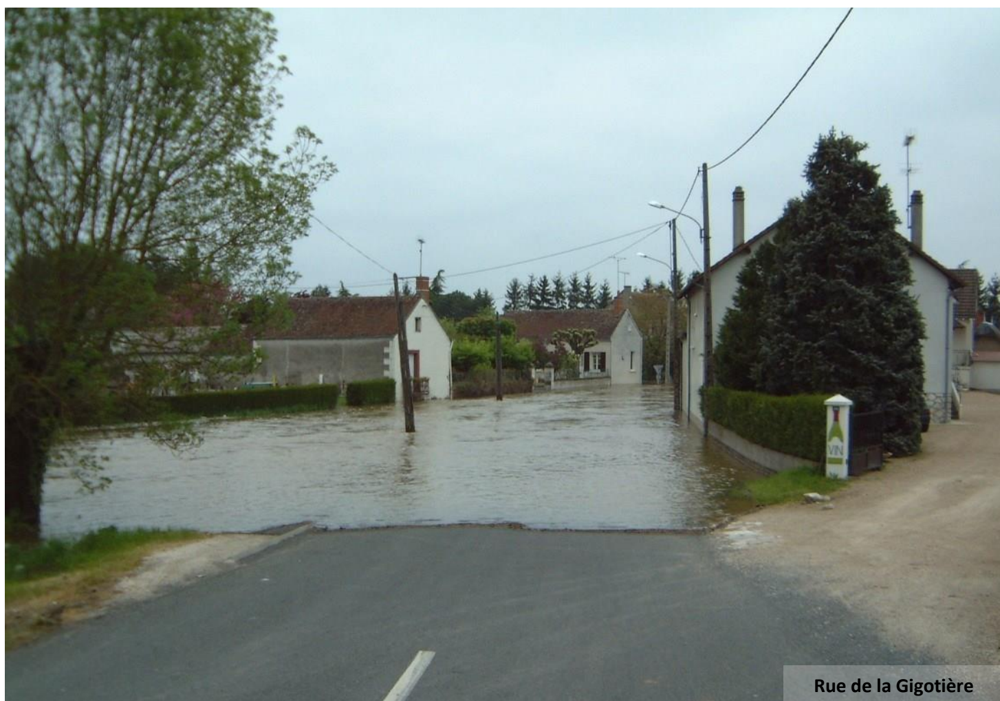
Rue de la Gigotière

MAIRIE DE NOYERS-SUR-CHER 54 rue Nationale – 41140 NOYERS SUR CHER Tél. : 02 54 75 72 72 E-Mail : mairie-noyers-sur-cher@wanadoo.fr www.noyers-sur-cher.fr